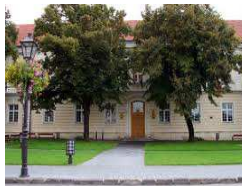
FZaSP TU, Univerzitné námestie 1, Trnava

AULA 1A1 , FILOZOFICKÁ FAKULTA, TRNAVSKÁ UNIVERZITA, Hornopotočná 23, Trnava