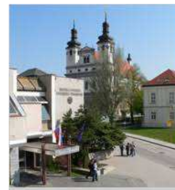
FF TU, Hornopotočná 23, Trnava