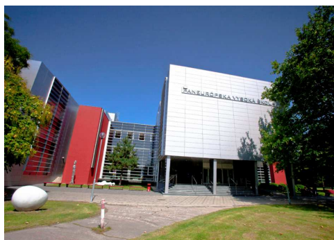
PEVŠ, Tomášikova 20, Bratislava

FAKULTA PSYCHOLÓGIE, PANEURÓPSKA VYSOKÁ ŠKOLA (PEVŠ) TOMÁŠIKOVA 20, BRATISLAVA https://www.paneurouni.com/fakulta-psychologie/