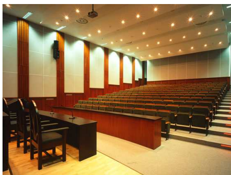
PEVŠ, Aula Maxima